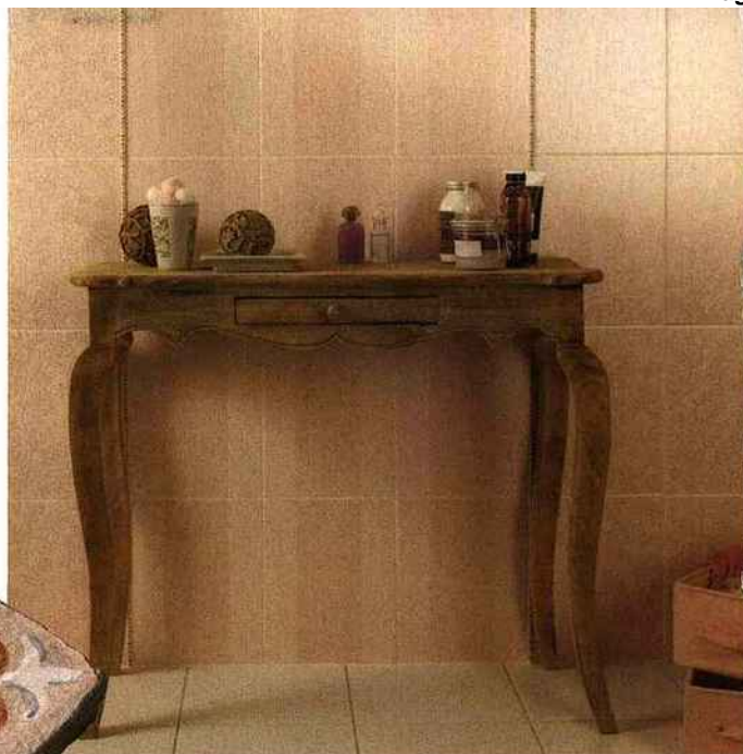
Le bois aime le rose qui l'adoucit avec dévotion et ne gâche pas l'effet champêtre. Desvres, carrelage Ray rose, à partir de 25 € environ le m².

O ui, le rose offre une mine radieuse à qui s'en approche... la salle de bain se l'approprie donc afin de combler une utilisatrice exigeante qui rêve de rayonner au cœur de sa pièce d'eau. Si les meubles n'osent franchir le pas de peur de perdre l'aspect champêtre recherché, le reste des accessoires s'imprègne littéralement de cette teinte bonbon. Serviettes, bouquets, savons... tout succombe au charme enfantin du rose.