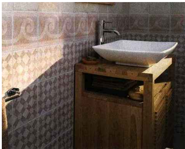
D'élégants reflets apportent leurs effets visuels à la salle de bain qui devient douce et rassurante. Castorama, carrelage 1930 Colours, à partir de 36,50 € environ le m².