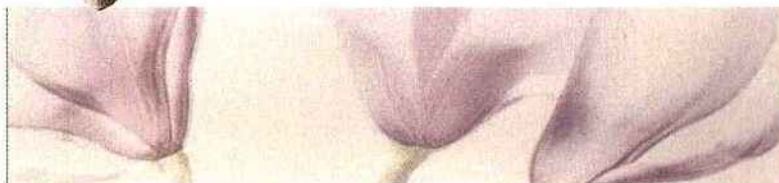
Une frise se gorge de fleurs sauvages ravissantes. Lapeyre, décor fleur Grokus, 20 € environ.

qui les premiers bénéficient de la douceur de cette teinte sucrée et savoureuse. Par le biais du carrelage ou de la peinture, il est possible d'offrir un bain de jeunesse à ses cloisons. La première solution exige une matière brillante qui