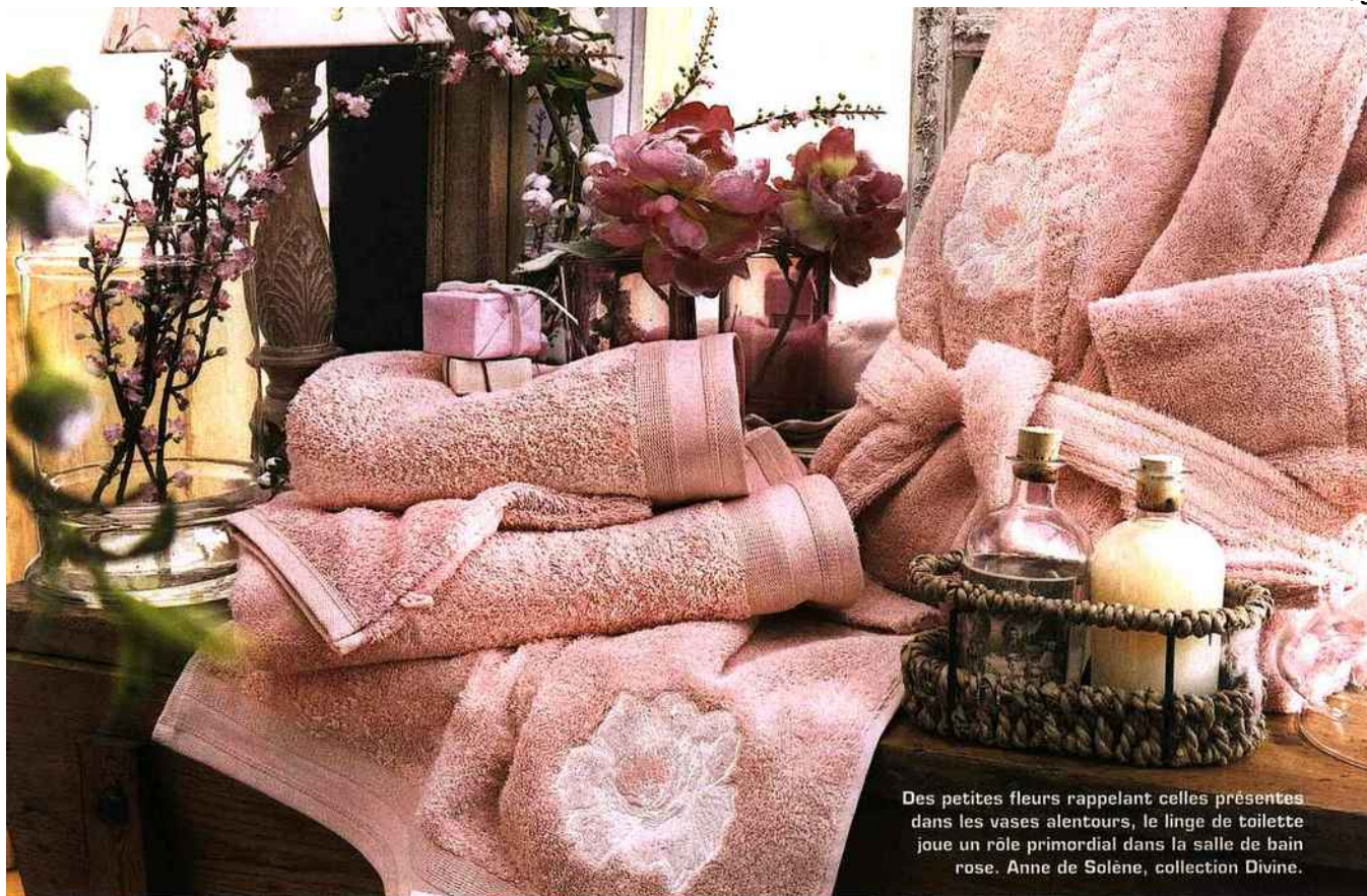
Des petites fleurs rappelant celles présentes dans les vases alentours, le linge de toilette joue un rôle primordial dans la salle de bain rose. Anne de Solène, collection Divine.

teinte plus légère sur les cloisons jouxtant la fenêtre et plus soutenue sur celles bénéficiant directement de la lumière. Sans cet effort, le rose peut paraître changeant et rompt alors l'uniformité recherchée.