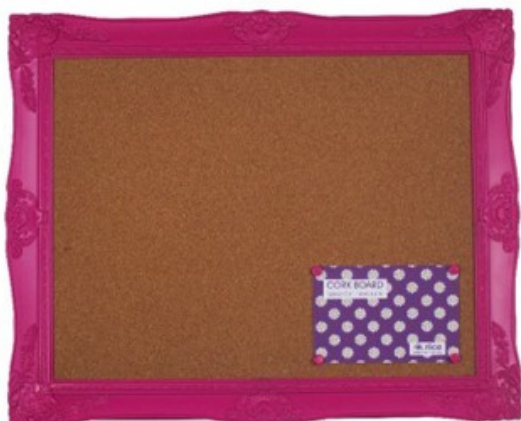
Tableau d'affichage rose

Incontournable dans une cuisine, le tableau mémo pour punaiser messages et recommandations.