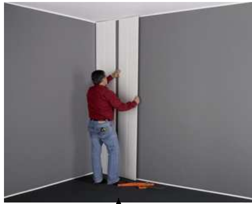
Emboîter la lame suivante