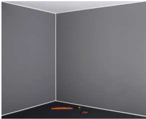
Fixer le socle des profils de finition