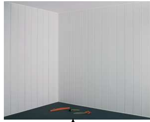
Clipper le couvercle des profils de finition

A noter : tous les sens de pose sont évidemment possibles : horizontale, verticale, en diagonale (fonction des dimensions de la pièce à équiper)