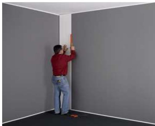
Poser la 1ère lame (guide de toutes les autres)